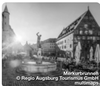
Merkurbrunnen © Regio Augsburg Tourismus GmbH multimap