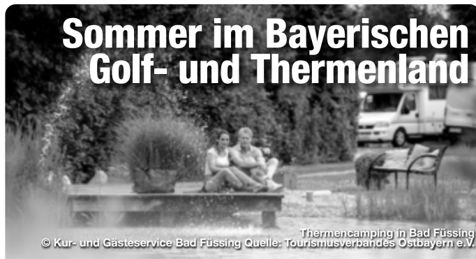
Thermencamping in Bad Füssing

Sommer in den Thermen des Bayerischen Golf- und Thermenlandes heißt neben dem Thermalbaden auch ganz viel draußen in der Natur sein. Die fünf Heil- und Thermalbäder der niederbayerischen Gesundheitsregion zwischen Passau, Regensburg und Landshut liegen eingebettet in wunderschöne Kulturlandschaften, die sich gerade im Sommer in Verbindung mit gesunder Bewegung aufs Schönste erkunden und genießen lassen.