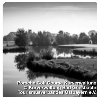
Porsche Golf Course Kurverwaltung

Mit 37 Pros, dem Golfodrom und der Golfakademie, die mit einem weltweit einzigartigen, patentierten Golflehresystem unterrichtet, ist Bad Griesbach das größte zusammenhängende Golf-Resort Europas. Vom 11. bis 15. Juli 2022 findet die Rottaler Bäderdreieck Golfwoche statt. Das Turnier wird über 18 Löcher ausgetragen, und zwar auf Bad Griesbacher Seite sowohl über den Porsche Golf Course, als auch über den Platz des Golfclubs Sagmühle, den Bella Vista Golfpark in Bad Birnbach und den Thermengolfplatz Bad Füssing in Kirchham.