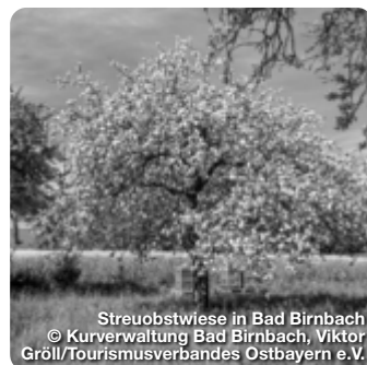
Streuobstwiese in Bad Birnbach

Streuobstwiesen sind ökologisch wertvoll: Vielen Tierarten bieten sie wichtige Lebensräume. Dem Menschen schenken sie duftende Blütenpracht und süße Früchte. In Bad Birnbach, dem ländlichen Bad im Bayerischen Golf- und Thermenland, werden die Rottaler Streuobstwiesen als Naturschatz gepflegt und für Urlaubsgäste erlebbar gemacht.