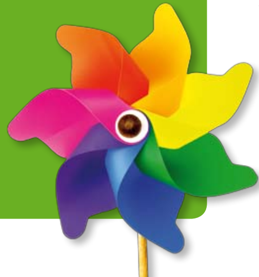
SABINE DUDDECK Kindertagesstättenleitung